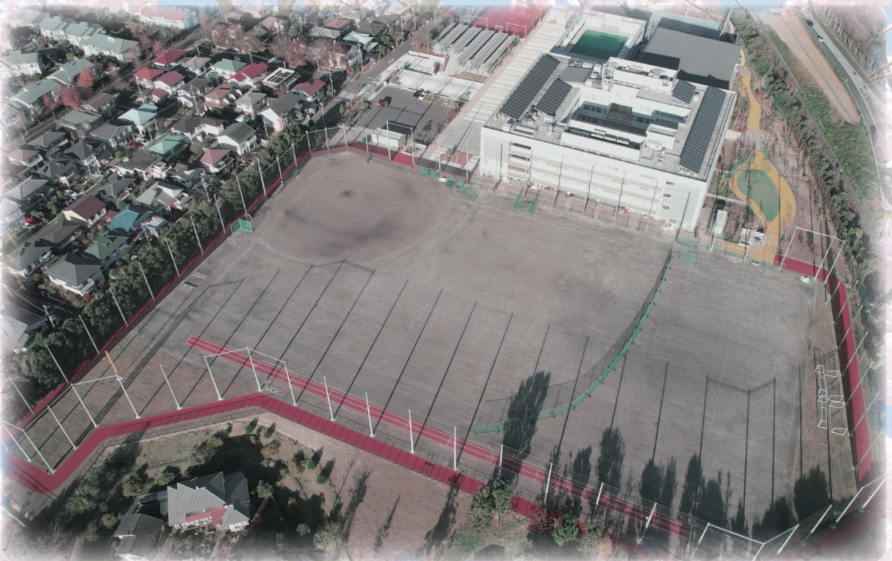
新しく生まれ変わった永山高校 (撮影日 令和5年12月4日)