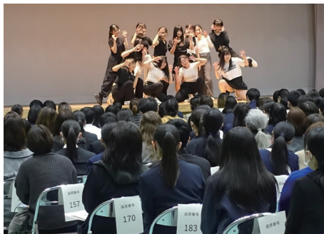
学校説明会におけるダンス披露 (11月12日)