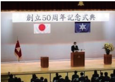
創立50周年記念式典 (10月29日)