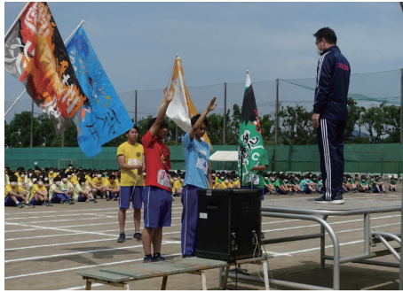
体育祭開会式 (6月3日)