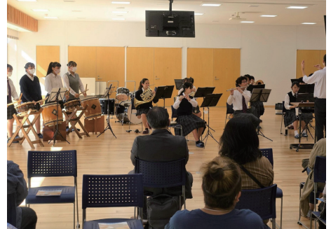
同窓会総会吹奏楽部と和太鼓部(10月1日)