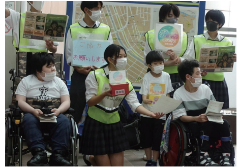
多摩桜の丘学園との募金活動 (7月14日)