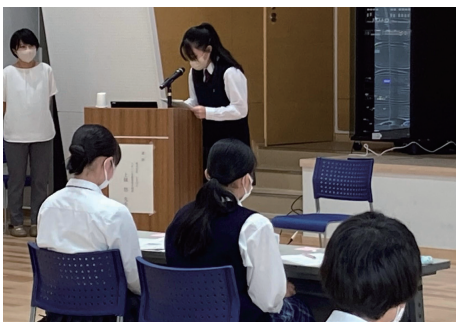
管理栄養士による栄養講習会 (9月3日)