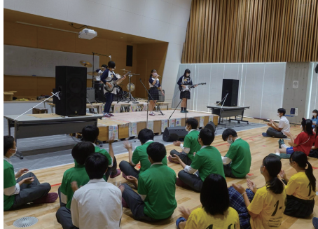
永高祭軽音楽部 (9月16日)